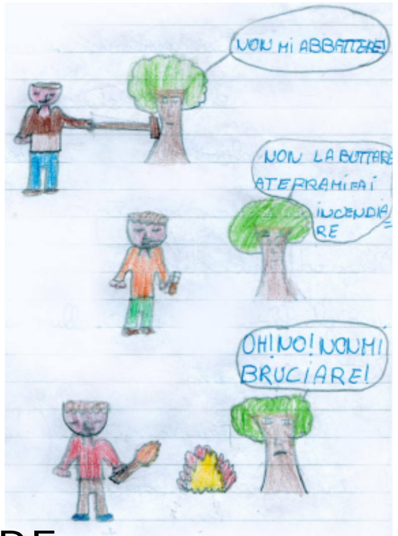
ILLUSTRAZIONE: CLASSE IV PLESSO AURANO